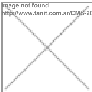
image not found http://www.tanit.com.ar/CMS-2025/thumbs-tanit/w160_PARTE A.png

A ESCUADRA DE ARMADO Familia: Escuadras Extrusora: ALUAR Línea: HERRERO